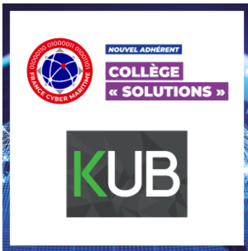
Post adhérent sur les réseaux sociaux